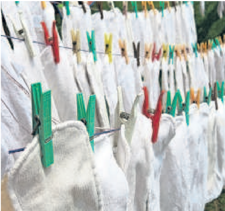
▲ Katoenen luiers zijn zo gek nog niet.